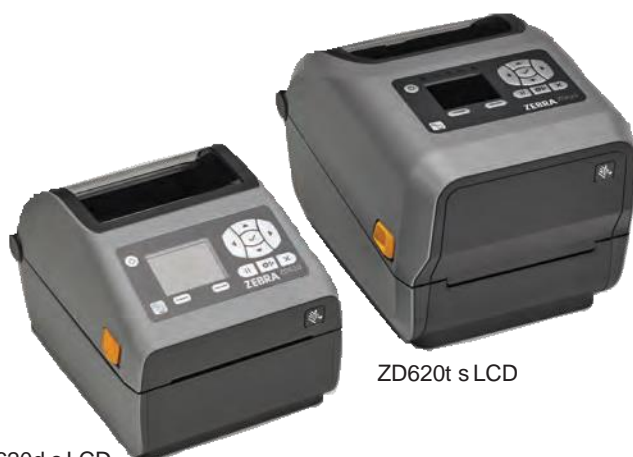
ZD620d s LCD

Tiskárny ZD620 jsou ideální tam, kde je rozhodující kvalita tisku, produktivita, flexibilita aplikací a jednoduchost správy. ZD620 představuje novou generaci pokročilých stolních tiskáren Zebra, nahrazující velmi oblíbenou řadu GX a ZD500. Vedle běžných stolních tiskáren vynikají tyto tiskárny špičkovou kvalitou tisku a pokročilými funkcemi. K dispozici jsou modely pro přímý termální i termotransferový tisk, ale také modely určené k využití ve zdravotnictví. Tyto tiskárny jsou tak ideální do prakticky každého prostředí. Vedle většiny standardních prvků a funkcí běžných stolních tiskáren Zebra nabízí tato produktová řada také například volitelné 10tlačítkové uživatelské rozhraní s barevným LCD displejem, který jasně a srozumitelně indikuje veškeré stavy tiskárny a případná nastavení. Odpadnou tak veškeré dohady, co tiskárna právě potřebuje. Tiskárny ZD620 jsou vybaveny operačním systémem Link-OS® a podporovány naším balíčkem aplikací Print DNA, včetně dalších utilit a vývojářských nástrojů, díky kterým mohou nabídnout výrazně vyšší kvalitu tisku, výkon, jednodušší vzdálenou správu a snadnější integraci do stávajících firemních systémů. Tiskárny řady ZD620 jsou ideální kombinací vysoké rychlosti a kvality tisku, ale také mimořádně snadné správy. Vy se tak můžete plně soustředit na další růst vaší firmy.